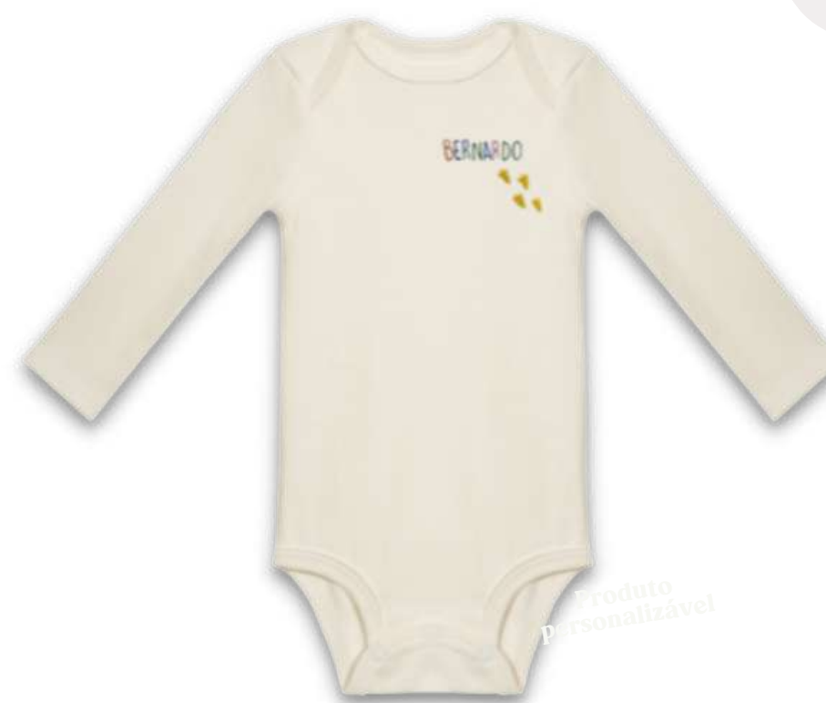
Body Manga Curta ou Longa bordado

Tecido suedine cru de malha dupla e ultra macio 100% algodão brasileiro certificado e livre de corantes. Abotoamento triplo com botões livres de níquel, chumbo e outros metais pesados. Feitos à mão