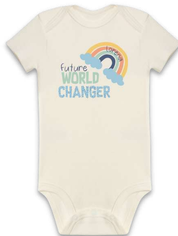
Body Manga Curta ou Longa Estampado

Tecido suedine de malha dupla, produzido 100% em algodão pima orgânico, super macio por fora e por dentro. Tingimento com produtos da certificação Oeko-Tex® que garante a ausência de produtos químicos perigosos à saúde e ao meio ambiente. Estampas de tintas a base de água. Botões livres de níquel, chumbo e outros metais pesados tóxicos. Disponível em algumas cores e estampas