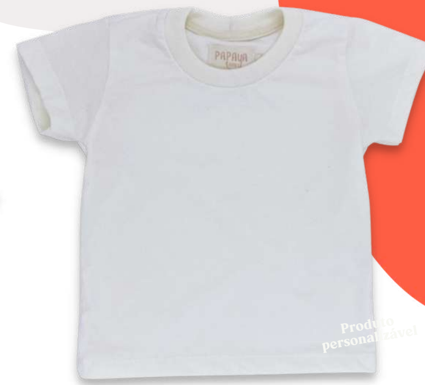
Camiseta Manga Curta para os mais crescidinhos

Tecido suedine cru de malha dupla e ultra macio 100% algodão brasileiro certificado e livre de corantes. Abotoamento triplo com botões livres de níquel, chumbo e outros metais pesados. Feitos à mão