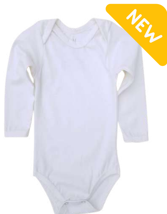
Body Manga Longa Liso

Body Esta peça essencial no enxoval do bebê, é a primeira roupa em contato com a pele, tanto para o verão quanto para o inverno. Por isso a importância de um tecido 100% natural